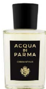
Osmanthus EdP ACQUA DI PARMA