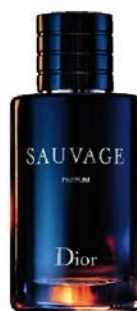
Sauvage Le Parfum DIOR