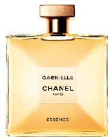
Gabrielle Chanel Essence EdP CHANEL