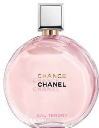
Chance Eau Tendre Eau de Parfum CHANEL