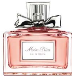
Miss Dior Eau de Parfum DIOR