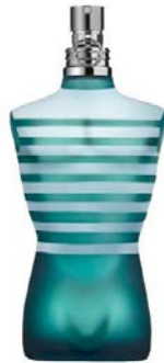
Le Mâle EdT JEAN PAUL GAULTIER