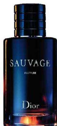
Sauvage Le Parfum DIOR